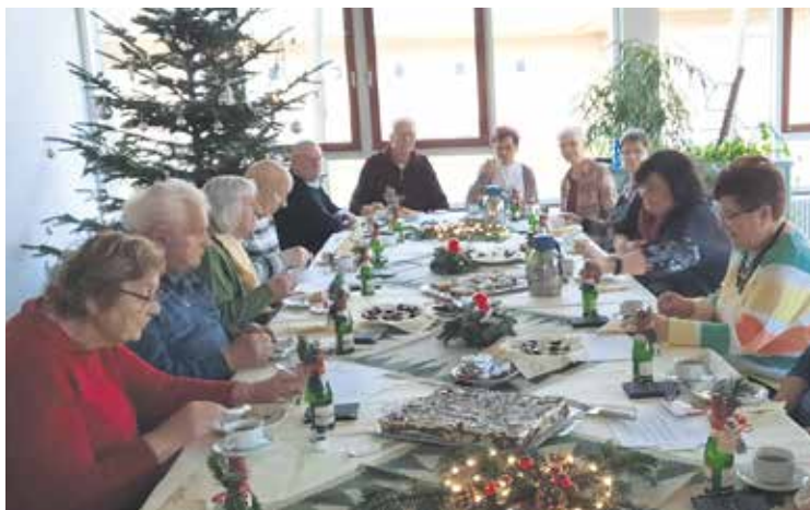
Im weihnachtlich geschmückten Saal des Berufsbildungswerks Stendal trafen sich die Mitglieder des Kreisverbandes Altmark-Ost.

Insgesamt war es eine gelungene Mitgliederversammlung. Mit einer kleinen weihnachtlichen Aufmerksamkeit wurden die Mitglieder in das Jahr 2023 verabschiedet.