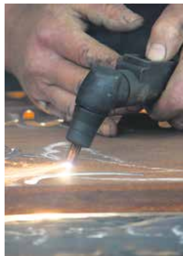
Einblick in ein Berufshandwerk.