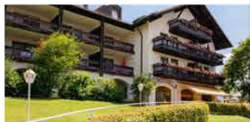
3★sup. Hotel Birkenhof Terme

Freizeit/Kur/Unterhaltung: Schöpfen Sie neue Kraft in der hauseigenen, 1.600 m 2 großen „Poseidon-Therme“ u.a. mit Süßwasser-Freibad (15 x 8 m, ca. 28°C), Thermal-Innenbecken (13 x 8 m, ca. 36°), Dampfgrötte und Infrarotkabine. Im Beauty- und Physiotherapie-Bereich können Sie sich gegen Aufpreis verwöhnen lassen.