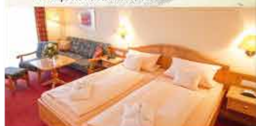
Zimmerbeispiel, 3★sup. Hotel Birkenhof Terme